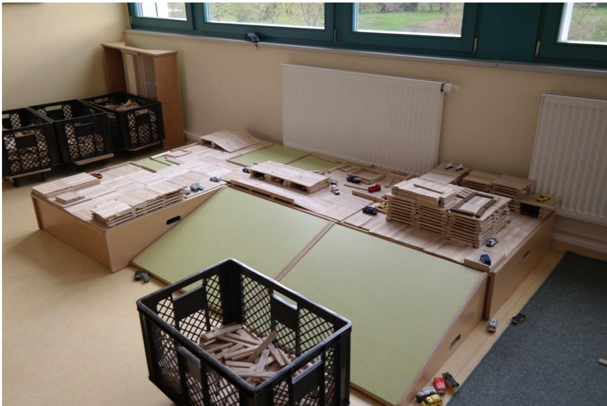
...Bauecken mit „Kapplasteinen“, Lego oder anderen Baumaterialien