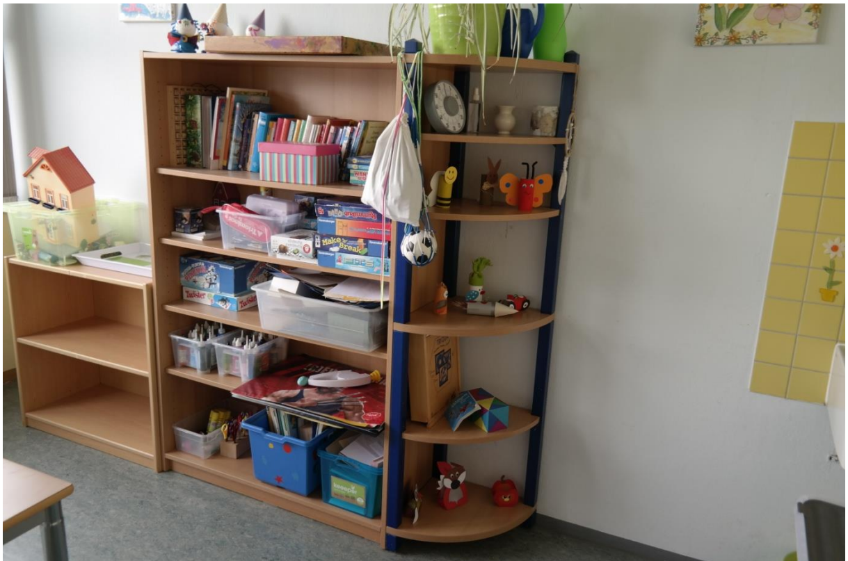
...Regale mit Spielen, Büchern und Bastelmaterialien